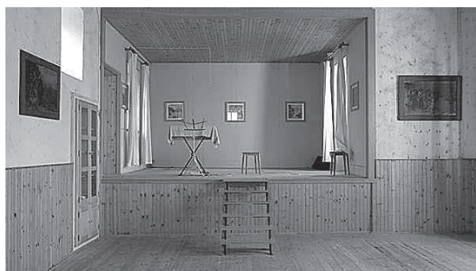
sl. 5. Kino u Smokvici danas