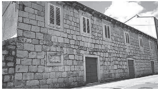
sl. 4. Ostaci platna ljetnog kina u Blatu