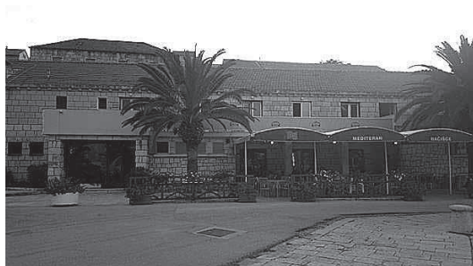
sl. 10. Stari Dom kulture u Lumbardi danas