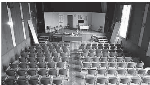
sl. 1. Lokacija prvog kina u Veloj Luci