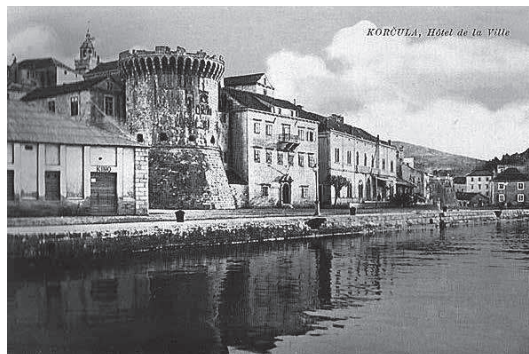
sl.8. Ljetno kino u Korčuli danas